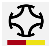
PUERTO DE SAN LORENZO