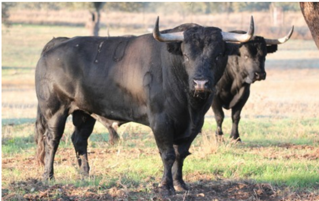
Prototype TAMARÓN-CONDE DE LA CORTE