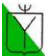
Héritiers d'Hubert YONNET

Les comportements décrits ci-après sont ceux des différentes branches d'origine PARLADÉ à l'exception des DOMECC, NUÑEZ et DOMECC-NUÑEZ (cf. fiches spécifiques).