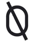
EL COLLADO Coquillas de S. ARJONA