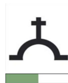
HOYO DE LA GITANA